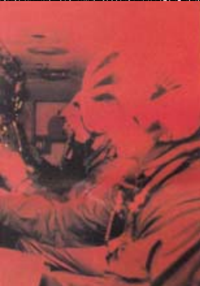
© Αμερικάνικη Βάση στο Άκτιο, 1965. Φωτογραφία του Ν. Α. Μανώλη (Αρχειοθήκη Ν. Α. Μανώλη)